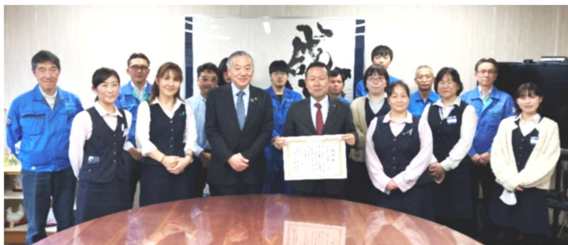
阿部市長を囲んで記念撮影

多摩ニュータウン環境組合管理者である多摩市長の阿部裕行様をご来社され、横倉社長に感謝状が手渡されました。